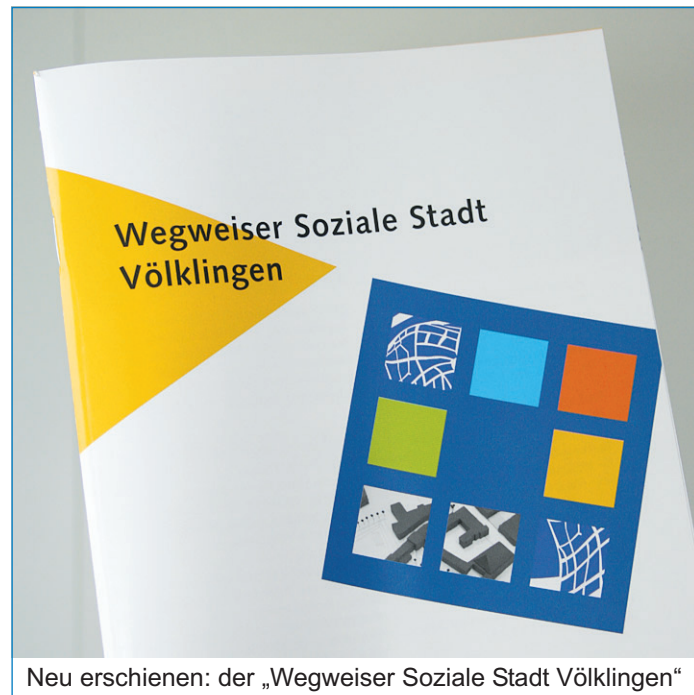
Neu erschienen: der „Wegweiser Soziale Stadt Völklingen“

Oft ist es nicht ganz einfach, sich im vielfältigen Geflecht von sozialen und öffentlichen Einrichtungen sowie Behörden und Kontaktstellen zu recht zu finden. Um den Bürgerinnen und Bürgern die Suche zu erleichtern, wurde auf Initiative der Stadt Völklingen und des Arbeitskreises Soziale Einrichtungen im Rahmen des Programms „Die Soziale Stadt“ ein sozialer Wegweiser für Völklingen erstellt. Er soll überflüssige Wege und umständliches Suchen ersparen. „Ziel der Broschüre ist es, unsere Bürgerinnen und Bürger auf das vielfältige soziale Netz unserer Stadt aufmerksam zu machen. Mein besonderer Dank gilt daher dem Arbeitskreis Soziale Arbeit Völklingen, welcher nicht nur an der Entwicklung des Wegweisers mitgewirkt hat, sondern diesen nun auch ganz gezielt Beratungssituationen an Hilfe Suchende aushändigen wird“, so Oberbürgermeister Klaus Lorig bei der Vorstellung der umfangreichen Pu-