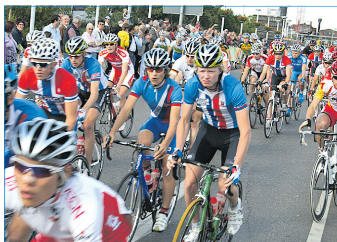
Start der Trofeo Karlsberg